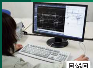
維持管理計画・ 補修設計