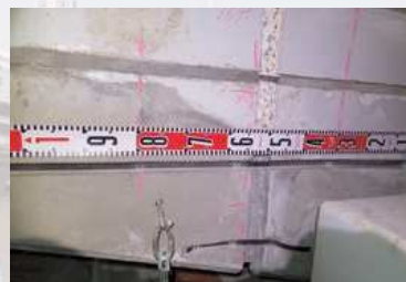
補修中（エルガード工法）

リフレドライショット工法 http://www.refre-dryshot.jp/