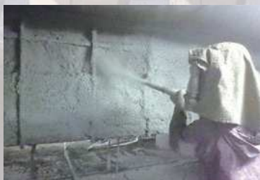
補修中（リフレドライショット工法）